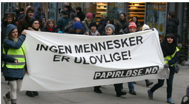
Papirløse: Får støtte i fagbevegelsen.