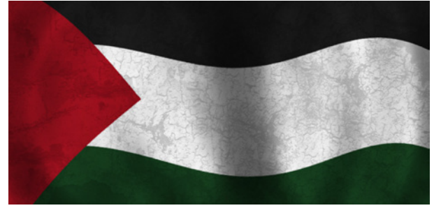
Seier i FN: Palestinerne har tatt et viktig skritt i kampen for en stat. Illustrasjon: Tariq Ramad.

– Vi må få samsvar mellom reglar for import og eksport av våpen til Israel. Så lenge regjeringa tillèt import, står Noreg den israelske okkupasjonsmakta. Raudt krev eit importforbod for våpen frå Israel på same grunnlag som Norge forbyr våpeneksport til landet, avsluttar Moxnes.