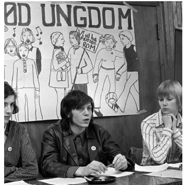
Den gang da: Rød Ungdom i de glade 70-åra.