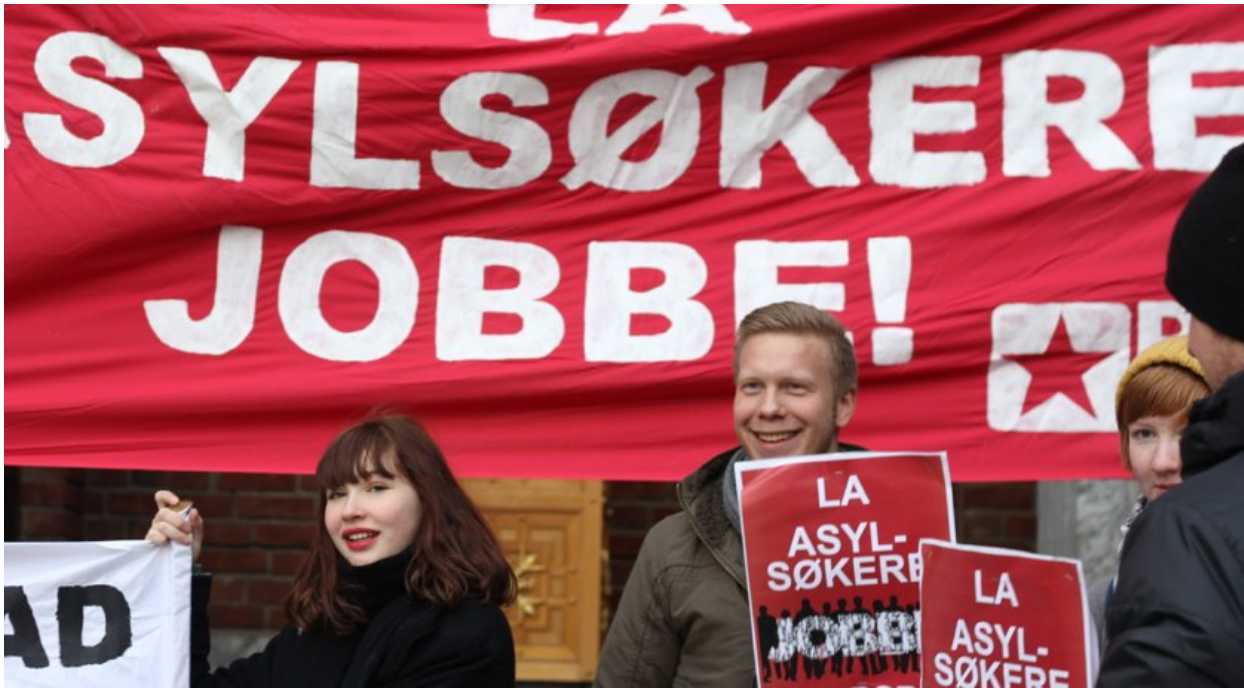
Antirasisme: Rød Ungdom vil at alle som bor i Norge skal kunne jobbe og bidra til fellesskapet.