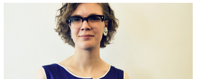
Rødt-nestleder: Marie Sneve Martinussen.

– Dette er en kamp det er verdt å støtte, mot privatisering av en fornybar, evigvarende matressurs som ikke kan måles i penger, sier Sneve