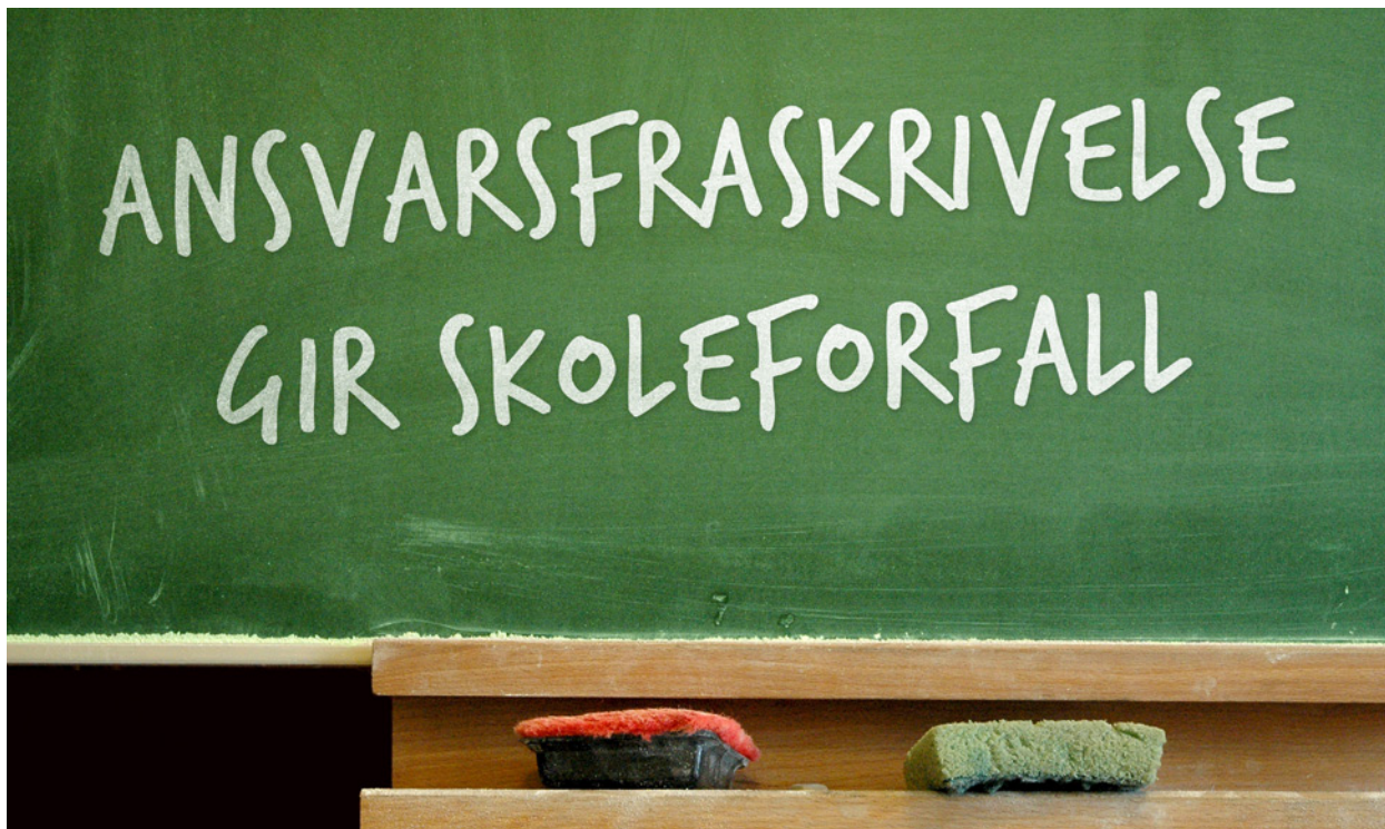
Forfall: Byrådet i Bergen mangler vilje til å prioritere langsiktig vedlikehold av skolebygg.

Les Nedregårds kronikker på http://tinyurl.com/cfhlfqj og http://tinyurl.com/cdtxbsx