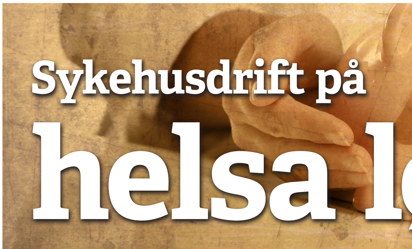
Kampen mot de røde tallene: Markedstenkningen får stadig større innflytelse i helsevesenet.

Utgiver: Rødt Osterhaus' gate 27 0183 Oslo