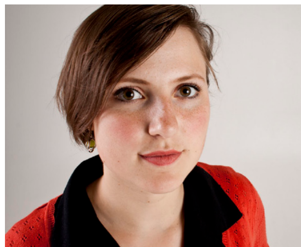
Rødt-politiker: Sofie Marhaug.

Marhaug har tatt opp situasjonen ved Nattland og andre skoler ved flere anledninger i bystyret. Hun mener skolene har blitt forsømt gjennom mange år.