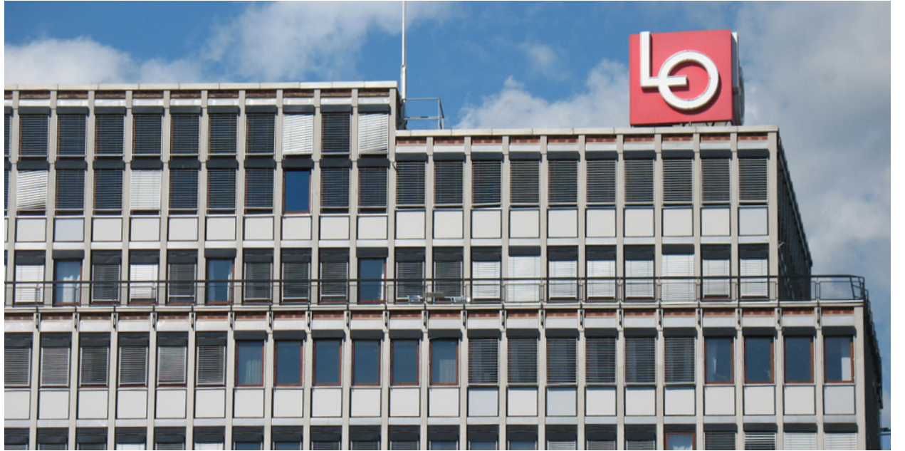
LO: Bør bryte med israelsk fagbevegelse som støtter okkupasjonen.